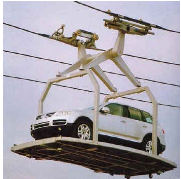
Wurde ebenfalls vorgestellt: Das ISETEC-Seilbahn-Projekt.